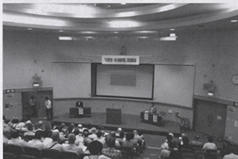
宇治市市民安全・安心推進旬間事業講演会