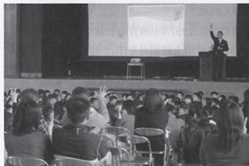
姫路市白浜小学校 PTA 対象講演会

結びになりますが、今回、このような掲載依頼を頂きました関係各所の皆様、ありがとうございました。明るい豊かな社会の実現と安全・安心のまちづくりを目指し、今後も、微力ながら地域の「防犯伝道師」を目指して活動して参りたいと思っています。