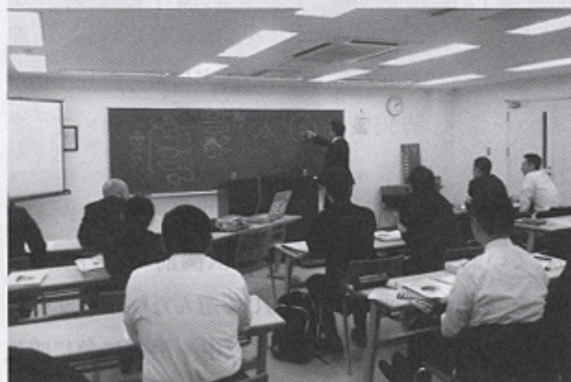
警察学校での授業の様子