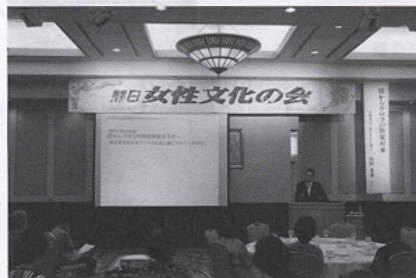
熊本市熊日女性文化の会講演会