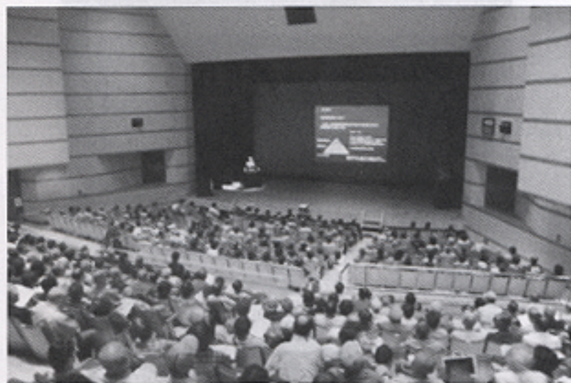
西宮市安心安全まちづくり 防犯講演会