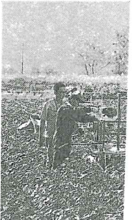
国内で漢方生えている (北)